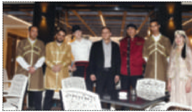
● طاقم المطعم

وماكولات تقليدية أذربية لاقى استحسان الرواد، كاشفا الثنية عن فتح فروع له في مناطق أخرى من الكويت. ومن جانبه، أكد القنصل سلطونوف استعداد السفارة وكذلك السلطات الأذربية على استقبال المستثمرين الكويتيين، معربا عن سعاداته البالغة لوجود منتجات أذربية بالكويت، وقال: إنها فرصة لزيادة الاستثمارات الأذربية في الكويت، داعيا في الوقت نفسه المستثمرين الكويتيين للاستثمار في أذربيجان، وأشار إلى أن الطاقم العامل بالمطعم أتى من أذربيجان، وذوي اختصاص، وهذا ما يسمح بتقديم خدمات أفضل للزبائن.