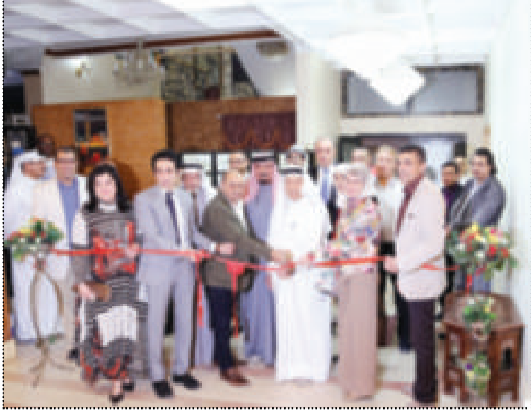
● قص شريط الافتتاح