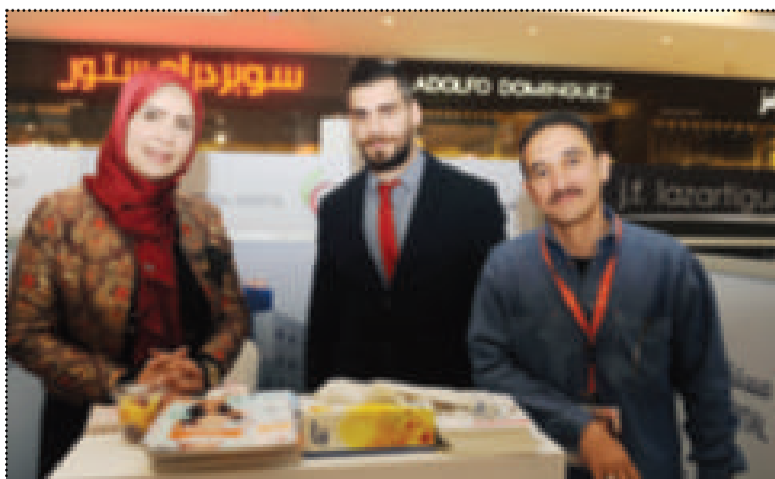
● بعض المشاركين