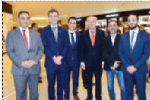
● السفير الهولندي فرانس بوتاييت متوسلا مجموعة من المشاركين