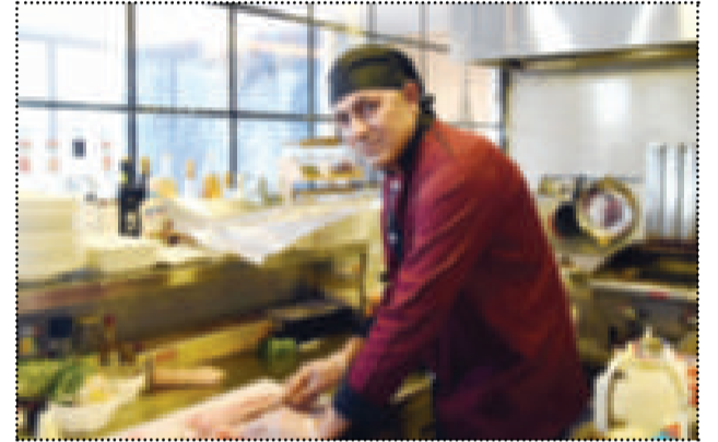
● الشيف يحضر الأكل