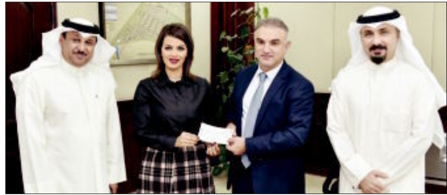
تقي متسلماً الشيك من الهندي

حرصاً على تحقيق التنمية المجتمعية المستدامة