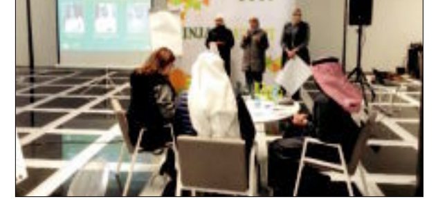
استعراض أحد المشاريع

اختتمت جمعية إنجاز الكويتية، ورتبة عمل «مخيم الابتكار الاجتماعي» التي أقيمت بالتعاون مع «زهاب»، في حديقة الشهيد، بمشاركة 70 طالباً وطالبة من مختلف الجامعات، واتسمت أجواؤها بالحماس والتفاعل بين الطلبة.