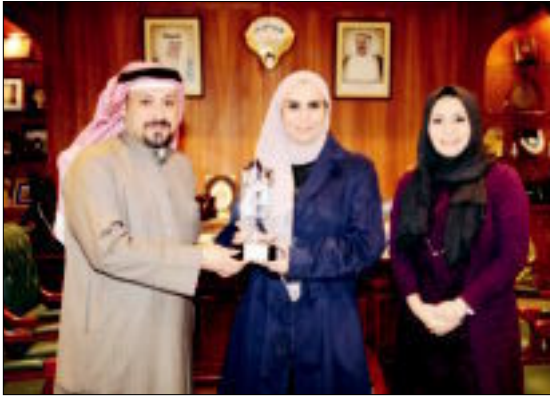
الغنيم متوسطة وفاتي والننفي

وقالت إن «الأشغال» تهدف من خلال المشاركة في المعرض، إلى تعريف الجمهور بإنجازات الوزارة في مختلف قطاعاتها، مثل الهندسة الصحية، والمشاريع الإنشائية، وقطاعي الطرق والصيانة، معربة عن فخرها بإنجازات الوزارة على جميع الأصعدة، لاسيما الإنشائية منها.