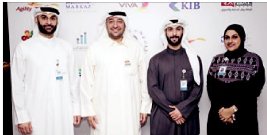
ممثل البنك خلال الفعالية

أعلنت عدد من الشركات العاملة في مجال البناء والتشييد في البلاد عن مشاركتها المتميزة في (معرض الصناعات والبناء الثامن)، وتنظّمه «كيبو- تاج» للمعارض والمؤتمرات بالتعاون مع شركة الصناعات الوطنية خلال الفترة من 10 إلى 13 ديسمبر 2018 بفندق جميرا المسيلة، بمشاركة واسعة من الشركات العاملة في هذا المجال من القطاعين العام والخاص.