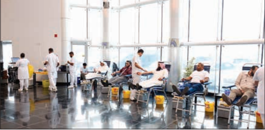
فريق عمل الشركة خلال حملة التبرع بالدم

تظمت شركة أعيان للإسجارة والاستثمار وشركتها التابعة بالتعاون مع بنك الدم المركزي حملة التبرع بالدم في مقر الشركة الجاري وتتقسم إلى جولتين. ويمكن الاطلاع على شروط المسابقة وبرنامجها بالتفصيل عبر موقع الملا للصيرفة www.altimulexchange.com .