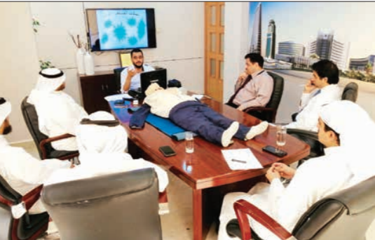
جانب من دورة الإسعافات الأولية في شركة «إنماء العقارية».

على نشر الوعي والتثقيف الصحي لمختلف شرائح المجتمع الكويتي من خلال طواقمها التدريبية على تنفيذ دورات الإسعافات الأولية، كما تمتد أنشطة الجمعية بخدماها الصحية والغرفية من نوعية في مختلف المجالات الصحية والثقافية والاجتماعية.