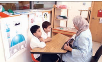
نشطة تعليمية وثقافية ممتدة للطلبة

الانتهاء من مناقشة الخطة الفرعية المتكاملة مع جمع أوقات الأوسر الذين اختبروا البرنامج، حيث يضم المركز 150 طالباً وطالبة من أعمار متفاوتة وهم موزعون في الفصول والورش حسب