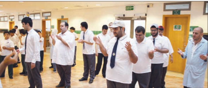
تعليم الطلاب المهارات الحياتية

الانتهاء من مناقشة الخطة الفرعية المتكاملة مع جمع أوقات الأوسر الذين اختبروا البرنامج، حيث يضم المركز 150 طالباً وطالبة من أعمار متفاوتة وهم موزعون في الفصول والورش حسب